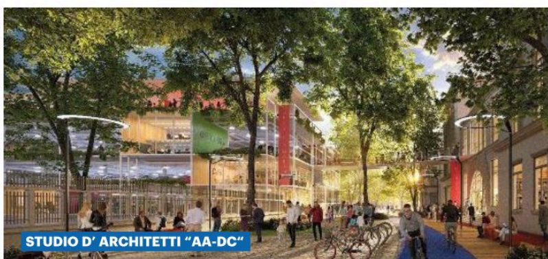
STUDIO D'ARCHITETTI "AA-DC"