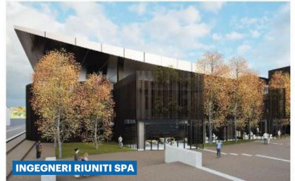
INGEGNERI RIUNITI SPA