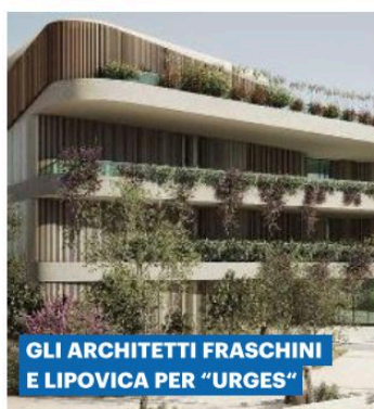
GLI ARCHITETTI FRASCHINI E LIPOVICA PER "URGES"