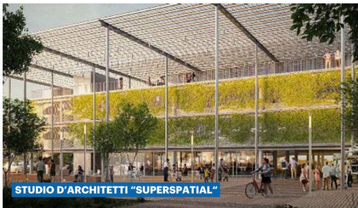
STUDIO D'ARCHITETTI "SUPERSPATIAL"

PRESENTATE PER IL CONCORSO DI IDEE E ORA ESPOSTE NELLA GALLERIA ROSSINI