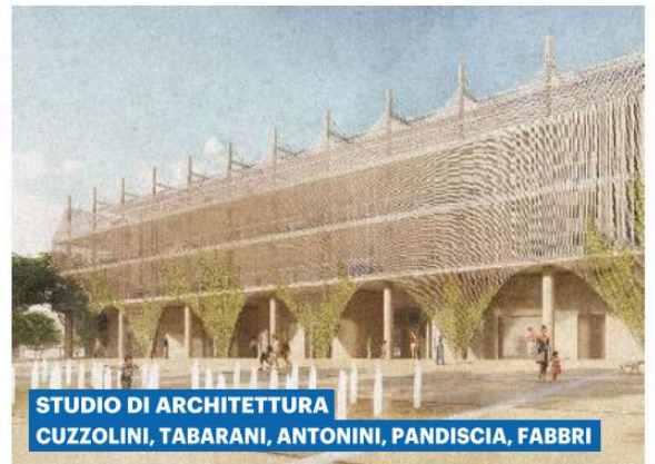
STUDIO DI ARCHITETTURA CUZZOLINI, TABARANI, ANTONINI, PANDISCIA, FABBRI